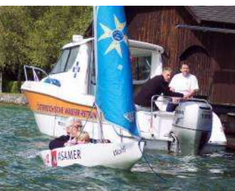
Mini 12 – ein Segelboot auch für Muskelkranke