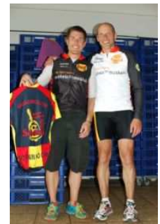
1.600 Euro Quadrolon Groß Bieberau

muskeln für muskeln will dazu beitragen, dass die spinale Muskelatrophie (SMA) mehr Aufmerksamkeit erfährt und dass das Spendenaufkommen, das wesentliche Grundlage für die Therapieforschung ist, erhöht wird. Dank der Unterstützung aller SMAider, also Euch, erreichen wir diese Ziele immer öfter. Der Auftritt von SMAidern bei den unterschiedlichsten Wettkämpfen in unseren Trikots zeigt hier deutlich Werbewirkung. So konnten wir dazu beitragen, dass auch in diesem Jahr wieder unter dem Stichwort „muskeln für muskeln“ zahlreiche Spenden bei der von uns unterstützten Initiative „Eine Therapie für SMA“ eingegangen sind. Besonders gefreut hat uns, dass wir in diesem Jahr auch mehrmals Charity Partner von Sportveranstaltungen waren. Ob beim Quadrolon, einer legendären Triathlon Veranstaltung in Hessen, einem Benefizfußballspiel in Neugablonz oder auch beim Airport Lauf am Münchner Flughafen. Von allen Veranstaltern wurden bedeutende Spendenbeträge übergeben. Allen Organisatoren und allen Spendern an dieser Stelle nochmals vielen Dank für Ihr Vertrauen. Wir freuen uns auf 2011.