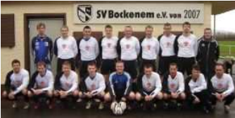
mit muskeln für muskeln Logo-SV Bockenem 2007