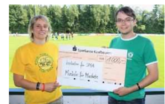
1.000 Euro Benefizspiel BSK Olympia Neugablonz vs. Eintracht Frankfurt