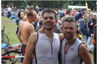
Gebrüder Freidank – TRI for SMA