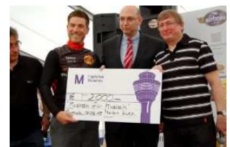
2.000 Euro Airport-Lauf München